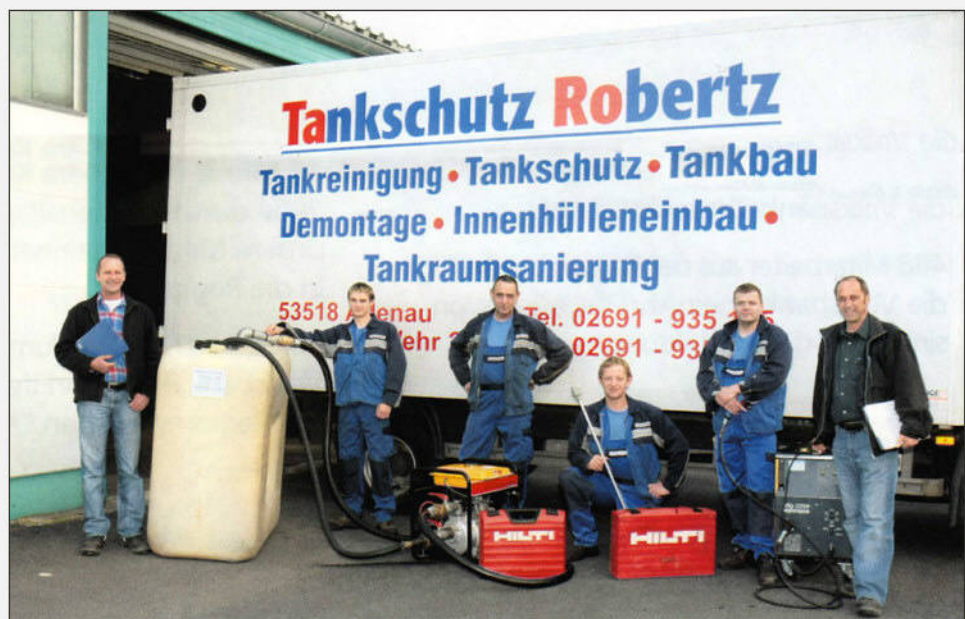
Das Team von Tankschutz Robertz, eine starke Mannschaft

Regelmäßige Fortbildung der Inhaber und des Fachpersonals und Prüfungsbescheinigungen des TÜV Rheinland belegen den hohen Gütestandard des Tankschutzteams Robertz! Zuverlässige Qualität zu fairen Preisen, das ergibt die gewünschte Kundenzufriedenheit! Und das alles im 24-Stunden-Notdienst! Das Robertz-Team ist auch überregional tätig.