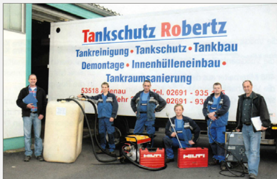
Das Team von Tankschutz Robertz, eine starke Mannschaft

Regelmäßige Fortbildung der Inhaber und des Fachpersonals und Prüfungsbescheinigungen des TÜV Rheinland belegen den hohen Gütestandard des Tankschutzteams Robertz! Zuverlässige Qualität zu fairen Preisen, das ergibt die gewünschte Kundenzufriedenheit! Und das alles im 24-Stunden-Notdienst! Das Robertz-Team ist auch überregional tätig.