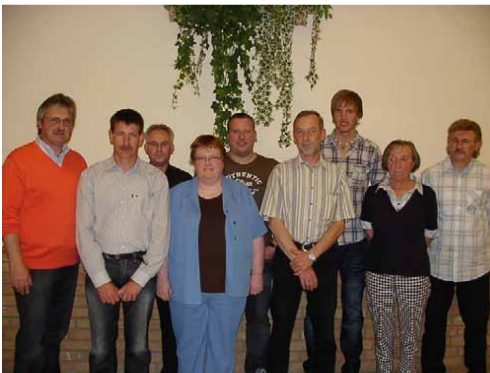
Der neue Vorstand 2009

Nach dem Punkt Verschiedenes, wo ein Infofilm der Nürburgring GmbH zum Bauprojekt 2009 gezeigt wurde, bedankte sich der Vorsitzende bei allen Anwesenden und wünschte eine gute Saison. Anschließend wurden bei Schnitzeln und Bier noch reichlich „Benzingespräche“ geführt.