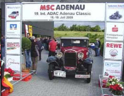
19. Int. ADAC Adenau Classic