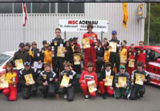
15. Adenauer ADAC Jugend Kart Slalom