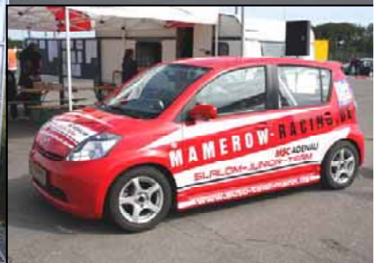
5. Adenauer ADAC Automobilslalom